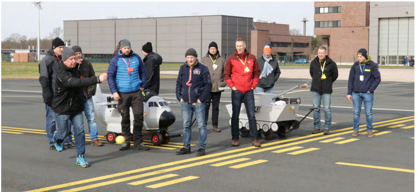
Die Mannschaften, hier die der Fliegenden Gruppe LTG 62 und der Firma Rheinmetall, hatten sich erneut mit viel Einfallsreichtum um die Gestaltung der Bollerwagen gekümmert.

Entgegen der Prognosen für das diesjährige Boßeln auf dem Fliegerhorst, konnten die Regenjacken zu Hause gelassen werden. Aufgrund des konstant starken Windes waren dicke Jacken, Mützen und Schals die angebrachte Boßelkluft. Bei zusätzlichem Sonnenschein lagen also optimale Bedingungen vor.