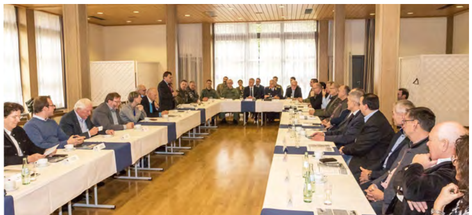
Zum Runden Tisch mit den Bürgermeistern aus der Region waren auch die Mandatsträger aus Wunstorf nach Bayern gekommen, um den Kollegen von ihren Erfahrungen mit dem A400M zu berichten.

Auf Initiative des örtlichen Bundestagsabgeordneten Hansjörg Durz, aus Augsburg, hatte die Bundeswehr zu einem Runden Tisch in die Lechfeldkaserne eingeladen. Bürgermeister und Mandatsträger aus der Region erhielten sowohl Informationen zu den Ausbauplänen aus erster Hand als auch die Gelegenheit, die Geräuschkulisse des A400M von außen und – im Rahmen eines Einweisungsfluges - von innen zu erleben.