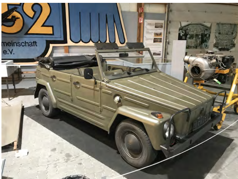
Der Neuzugang VW 181 ausgestellt in der Ju-Halle.

Unser VW 181 ist Baujahr 1972 und nahezu im originalen Zustand.