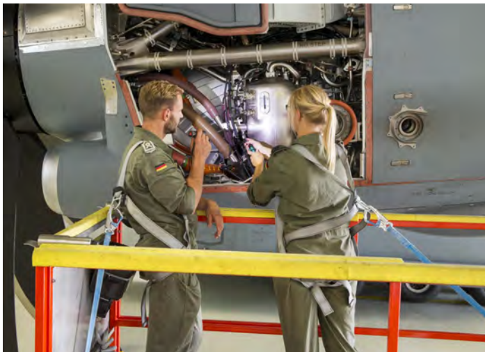
Teamarbeit ist bei der Arbeit am A400M gefragt.

Somit werden ab 2027 insgesamt 180 zivile Azubis gleichzeitig zu Facharbeitern in Wunstorf ausgebildet. Hierfür wird weiter investiert. Nach aktuellen Planungen soll 2024 eine neue Ausbildungswerkstatt fertiggestellt sein.