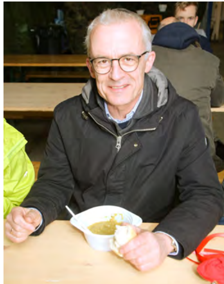
Bei seinem letzten Boßeln als Hausherr schmeckte auch dem Kommodore der Erbseneintopf.

Zur Stärkung zwischendurch gab es auf der Hälfte der Strecke Erbsensuppe und Heißgetränke. Ausrichter waren die Vorjahressieger Polizei Wunstorf und Feuerwehr Wunstorf, die bei der Planung und Durchführung von vielen helfenden Händen des Fliegerhorstes unterstützt wurden. Eine gelungene Kooperation von Polizei, Feuerwehr und Bundeswehr.