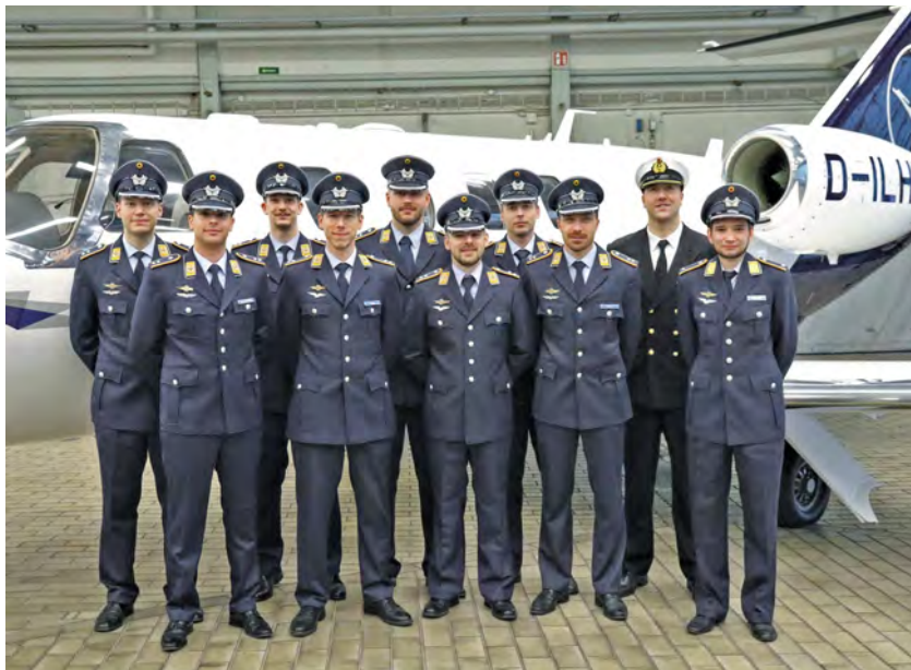
Crew Bw 02/18 mit dem Objekt der Begierde.