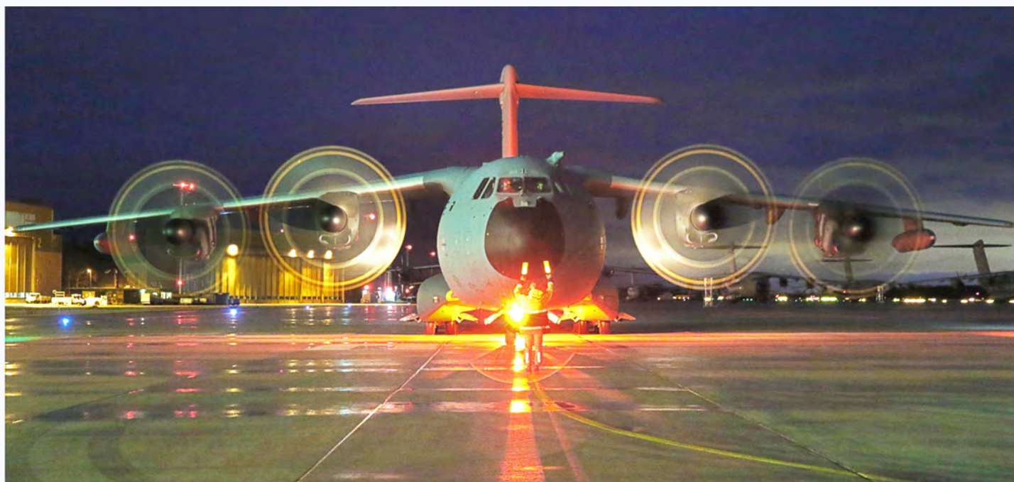
Das war schon eine besondere Herausforderung. Passagieraufnahme bei Nacht und mit laufenden Triebwerken.

Mission erfolgreich beendet. A400M sicher um 17.24 Uhr in Wunstorf gelandet. An Bord: 86 Passagiere. Das Flugzeug war mit aktiven Schutzeinrichtungen gegen Raketenbeschuss unterwegs. Hier beschreibt der zweite Pilot den Flug, bei dem im Januar die deutschen Soldaten aus dem Krisengebiet Irak ausgeflogen wurden.