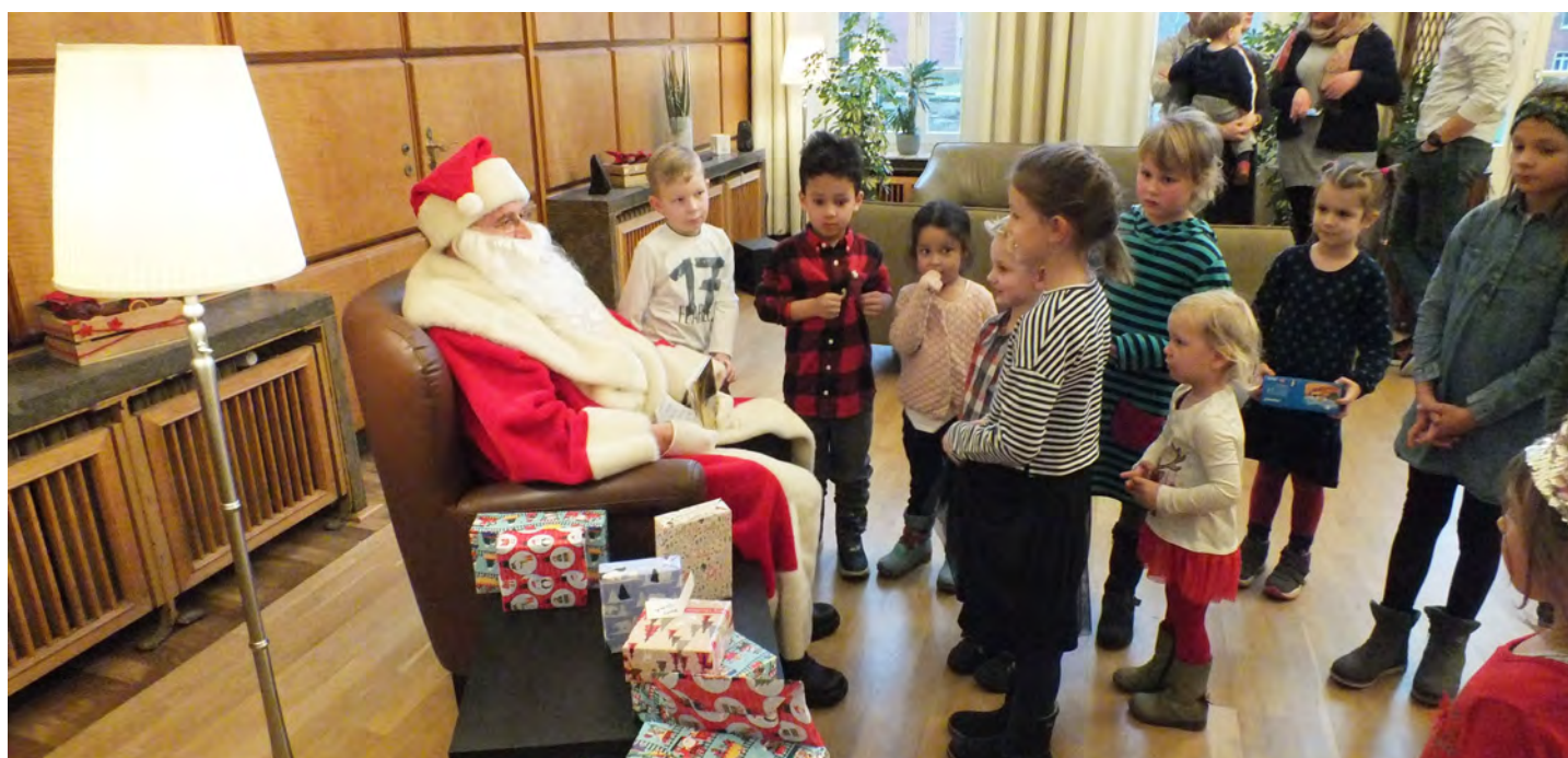
Mit tiefer Stimme wusste der Nikolaus zu jedem Kind eine persönliche Geschichte zu erzählen.