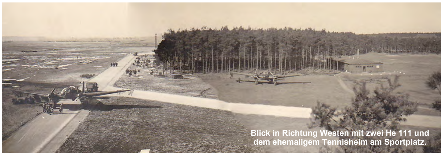
Blick in Richtung Westen mit zwei He 111 und dem ehemaligem Tennisheim am Sportplatz.