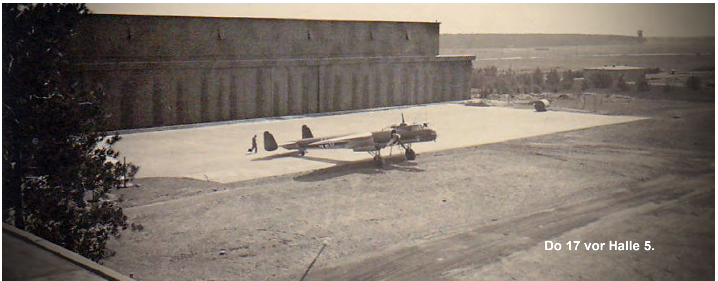
Do 17 vor Halle 5.