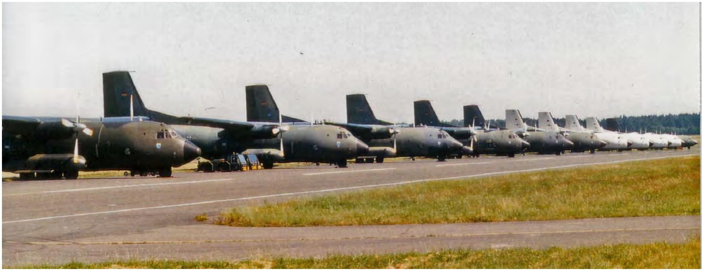
Beim „Tag der offenen Tür“ im Juni 1994 wurden 11 C-160 auf der Startbahn 2 geparkt