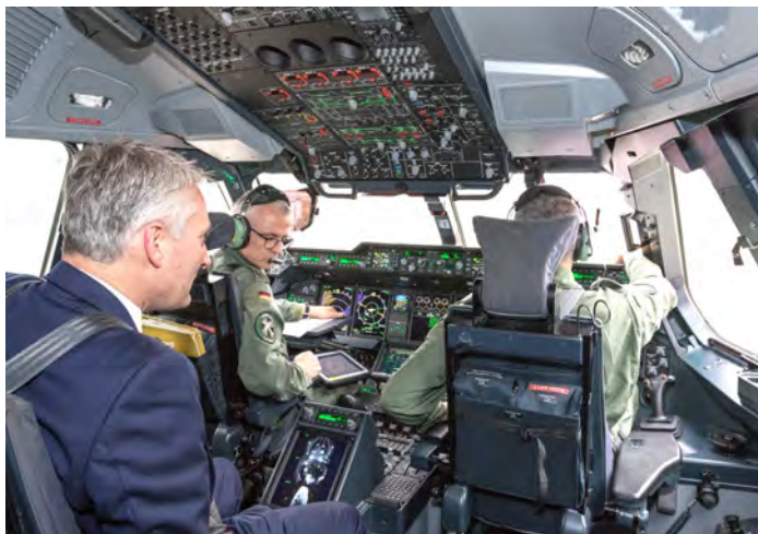
Der Wahlkreisabgeordnete des Bundestages, Hansjörg Durz, im Cockpit des A400M. Pilot ist Kommodore Oberst Ludger Bette .

Deswegen gebe es eine große Akzeptanz unter den Bürgermeistern. „Der Standort Lechfeld ist langfristig gesichert und das ist eine hervorragende Nachricht für die Region“, so der Abgeordnete weiter.