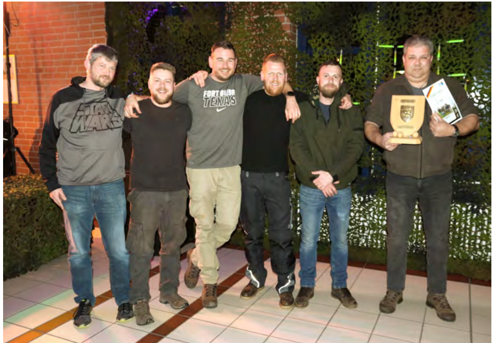
Wie schon vor zwei Jahren nahm das Systemzentrums 23 wieder die Siegetrophäe mit nach Hause.

Am Ende hatte die Mannschaft des Systemzentrums 23 die wenigsten Würfe für die Strecke gebraucht. Sie nahmen - wie schon vor zwei Jahren - wieder die Siegetrophäe mit nach Hause und werden somit für die Organisation im nächsten Jahr verantwortlich sein.