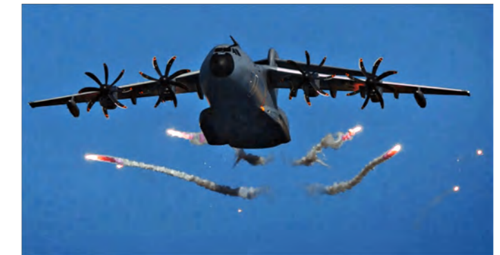
A400m beim Ausschuss von Infrarot Täuschkörpern.

Die Möglichkeit des Selbstschutzes des A400M ist in den vergangenen Jahren stetig angewachsen. Im Juli 2018 flog erstmals ein A400M direkt nach Mazar-e-Sharif. Möglich machte dies das neue Armoring Kit, dass das Transportflugzeug gegen ballistische Angriffe schützt. Parallel wurde an der Zertifizierung des elek-