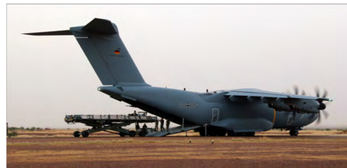
Bei laufenden Triebwerken wurde der PFA in 20 Minuten aus dem A400M auf der Piste entladen.

Dieser Flug hätte mit der Transall aufgrund der Größe und des Gewichts des PFA 50 nicht durchgeführt werden können und war somit einer, der vielen noch folgenden Meilensteine für das LTG 62. Mit dem A400M kann im Vergleich zur Transall das Dreifache