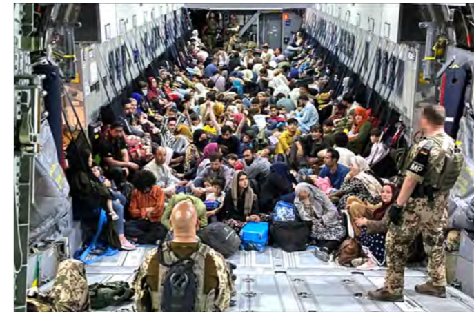
Die Evakuierungsmission in Afghanistan war einer der schwierigsten und gefährlichsten in der Geschichte der Bundeswehr.

62 ein spezieller Laderaumsimulator zur Verfügung. Am Beispiel des GTK-Boxer ist ersichtlich, wie ein solcher Test abläuft. Durchgeführt werden diese Versuche von der Gruppe für Technik, Taktik und Verfahren (TTVG) des LTG 62.