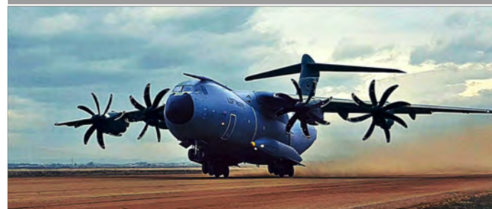
Nach dem erfolgreichen Test in 2019 stand diese Fähigkeit zur Verfügung.