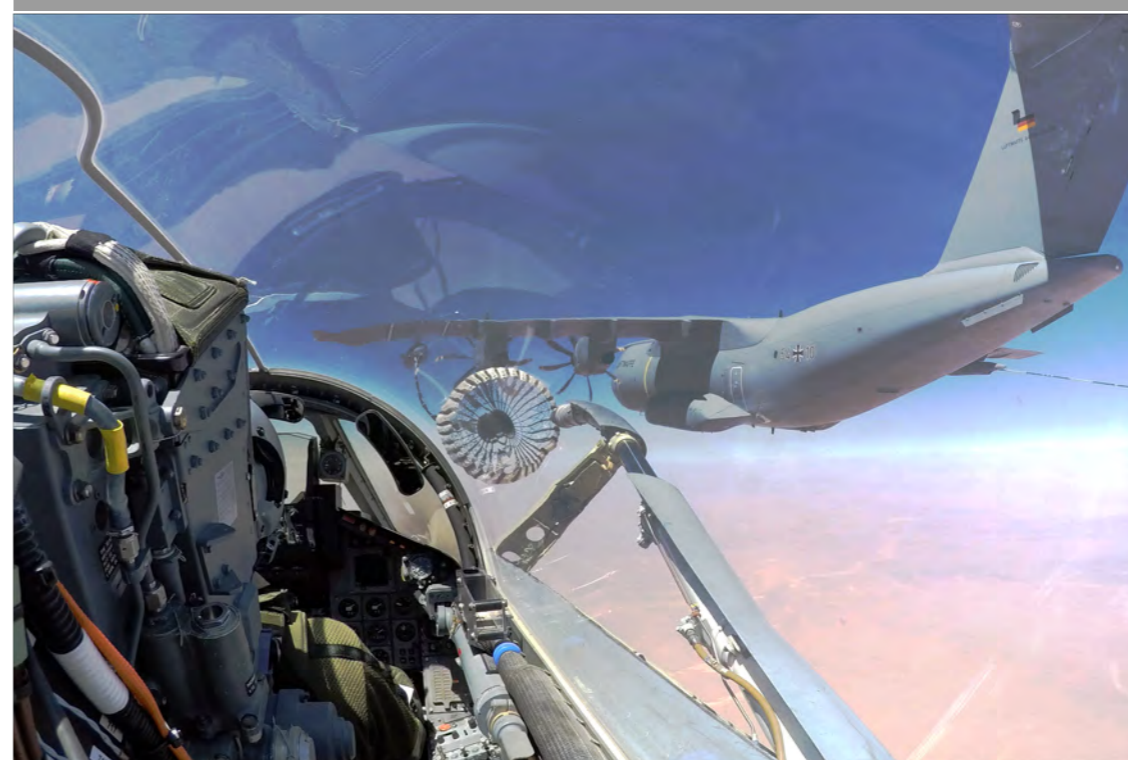
Blick aus dem Cockpit eines Tornados der LW während der Luftbetankung.

Seit Anfang März 2019 stehen A400M des LTG 62 als "fliegende Tankstellen" für Kampfflugzeuge zur Verfügung. Hierbei werden, aus zwei, seitlich an den Tragflächen montieren Behältern, Schläuche ausgefahren.