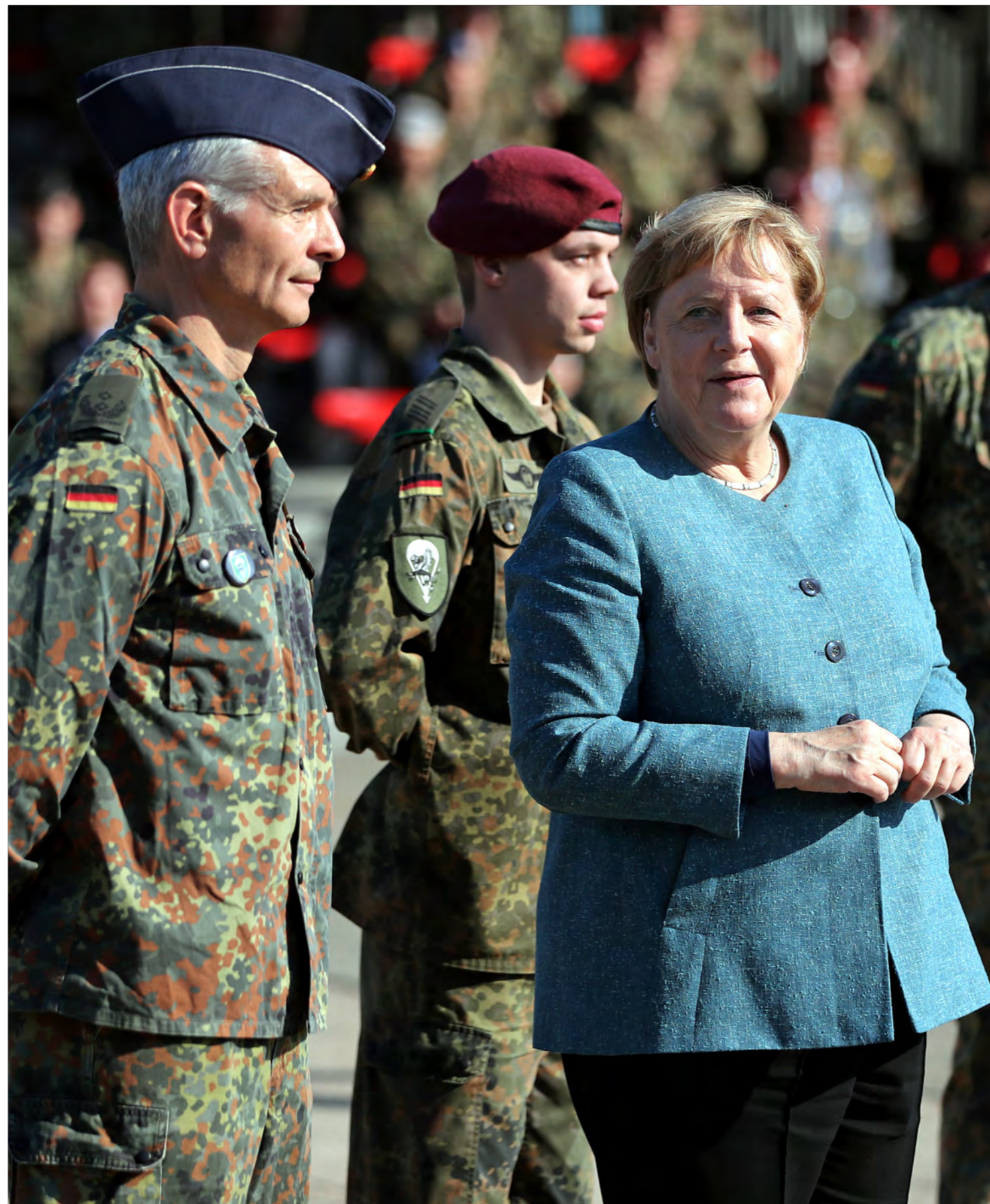
Stellvertretend für das LTG62 wurden zwei Soldaten

„5.347 Menschen haben durch den Einsatz der Bundeswehr eine Chance auf eine sichere, bessere Zukunft“, sagte Kramp-Karrenbauer. Dafür gebühre den Soldatinnen und Soldaten, aber auch allen anderen Beteiligten von der Bundespolizei und dem Auswärtigen Amt der Dank aller Deutschen. Die Ministerin