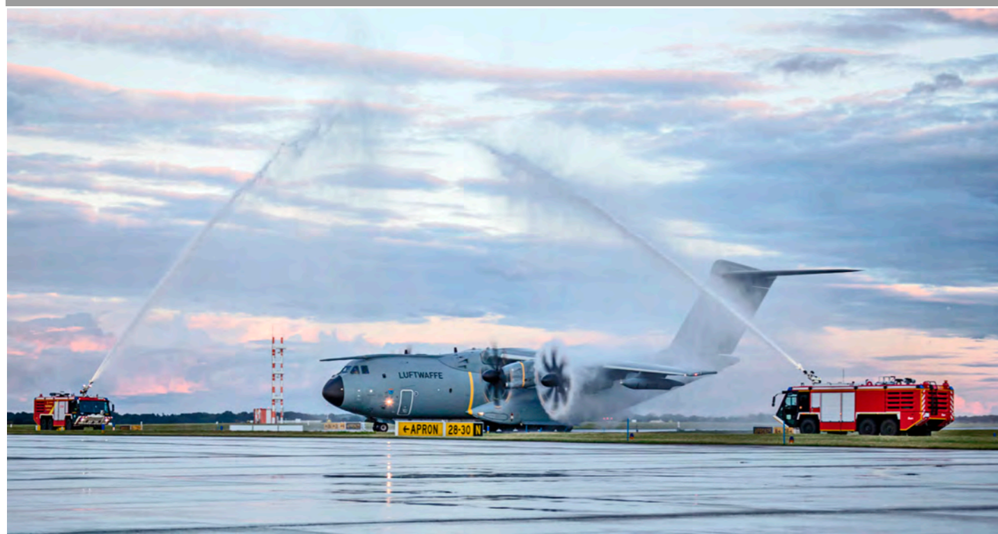
Zurück aus dem Evakuierungseinsatz in Wunstorf.