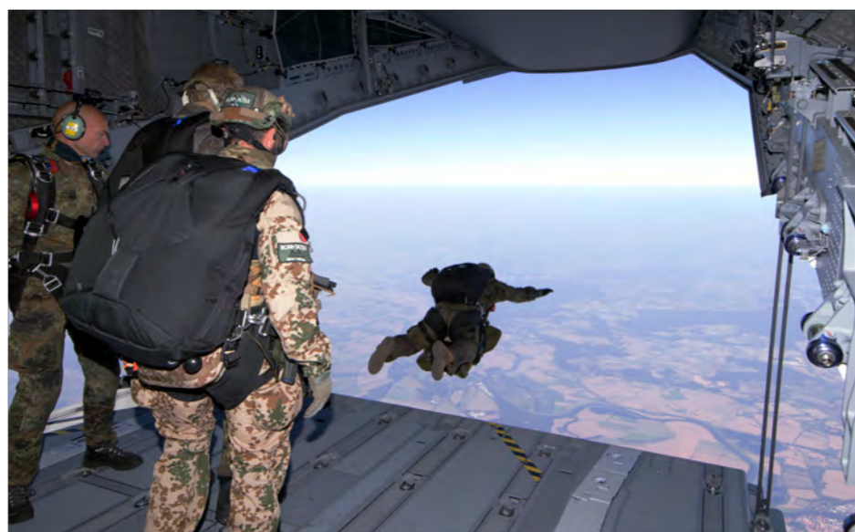
Die Absprunghöhe kann bei den Freifallern je nach Auftrag variieren.

Die Einrüstung erfolgt individuell, je nach Anzahl der Patienten und deren Erkrankung durch die Medizingeräte-techniker des Fliegerarztbereichs des LTG 62. Der kleinste MedEvac-Rüstcode besteht aus zwei PTE (Patienten Transport Einheiten), der Größte aus sechs.