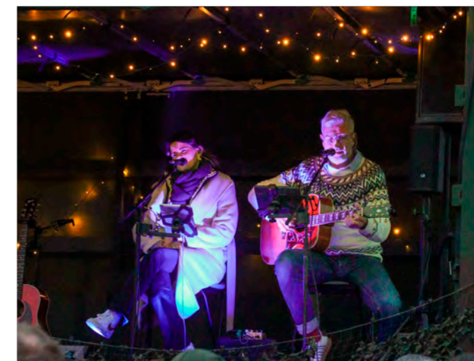
Duo der Band High Infidelity.