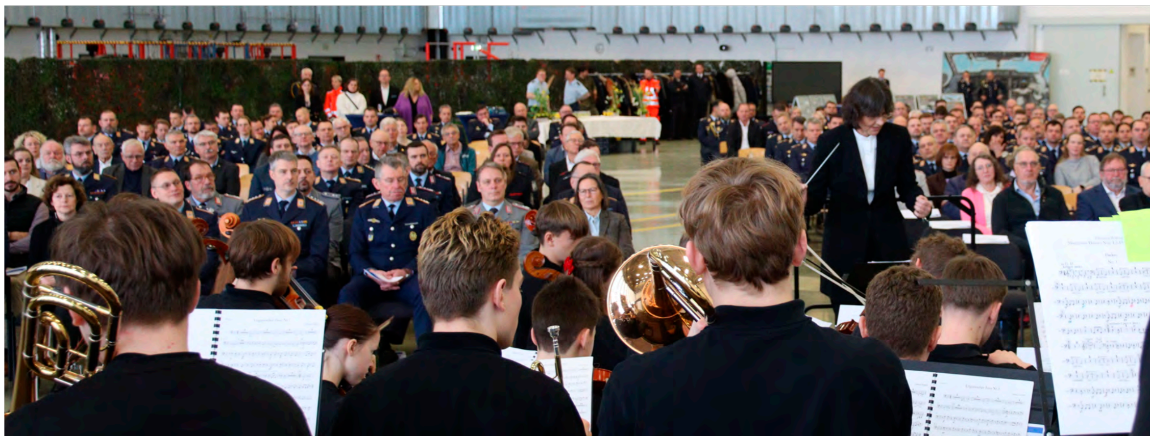
Unterstützung durch das Orchester der Musikschule Wunstorf.