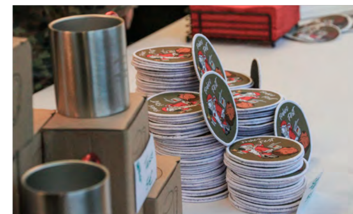
Der diesjährige Weihnachtspatch wurde durch die Helfenden Raben auf der Weihnachtsfeier verkauft.